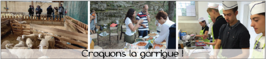
Croquons la garrigue !

ACCUEIL EVÉNEMENTS LES RENCONTRES ▼ LES MENUS CARTOGRAPHIE BIBLIO / INTERNET CONTACTS